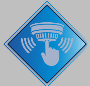
Sistema de Detección y Alarma.