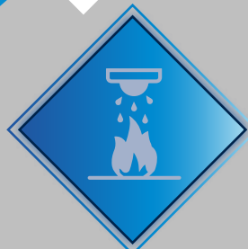
Sistemas de Protección Contra Incendios